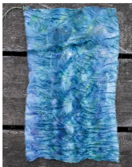
Gemeine Akelei-Blüten auf Seiden-Satinstoff