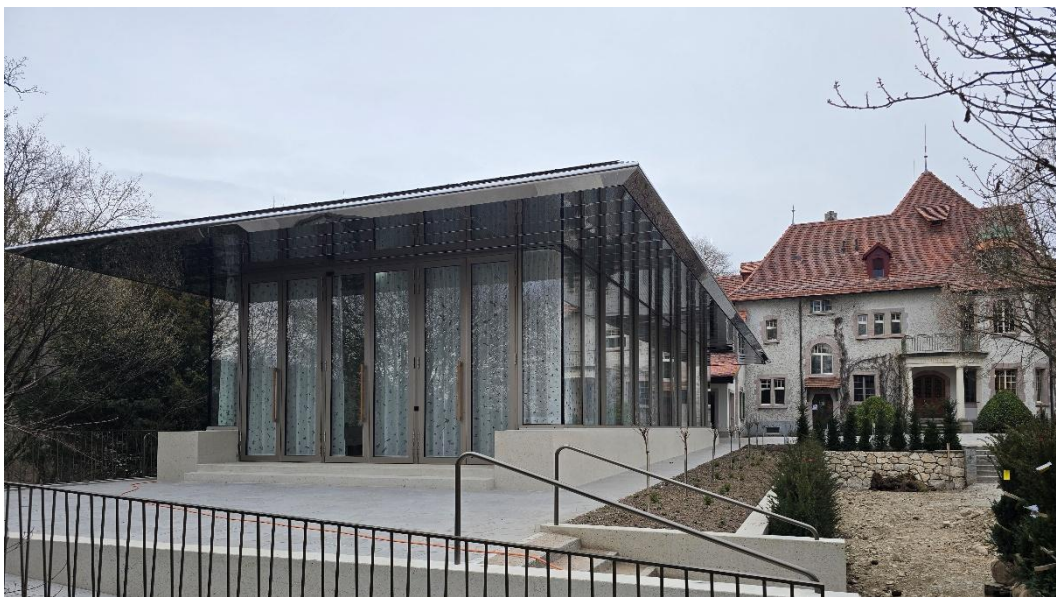
Foto: Der neue Pavillon «en plein air» des Architekturbüros Ernst Niklaus Fauch Partner AG