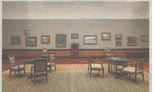
Frisch herausgeputzt: ein Saal mit Impressionisten.