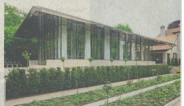
Der neue Pavillon im Museum.