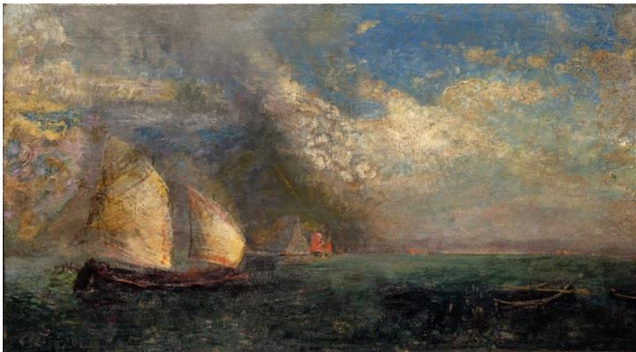
Bild 2: Odilon Redon, Fischerboote. Erinnerung an Venedig , um 1908, Öl auf Holz, 40,0 x 73,5 cm, Museum Langmatt, Baden

Das Format Kaffee, Kunst und Kuchen lädt die Besucher*innen zu einer halbstündigen Bildbetrachtung eines ausgewählten Meisterwerkes aus der Sammlung des Museums Langmatt. Am 17. Oktober erschliesst Markus Stegmann, Direktor Museum Langmatt, die Wirkung des Bildes Fischerboote. Erinnerung an Venedig von Odilon Redon und vermittelt Hintergrundinformationen zum Künstler, der Entstehungszeit und Provenienz. Anschliessend bietet das Veranda-Café bei einer Tasse Kaffee und einem Stück Kuchen die Möglichkeit zum individuellen Austausch. Am Sonntag, 13. Oktober, 10.30 Uhr, ist das Bild Thema des Gottesdienstes von Christina Huppenbauer, Pfarrerin, Reformierte Kirche Baden.